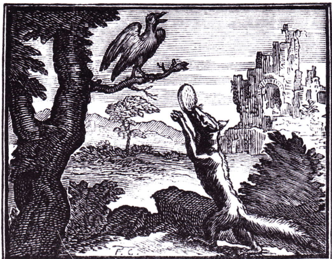
Illustratie uit Fables van Jean de la Fontaine, 'Le Corbeau & le Renard'

Mensen hebben een diepgeworteld gevoel voor symboliek en rituelen, dat het mogelijk maakt delen van de werkelijkheid te ervaren die met het verstand onbereikbaar zijn. Symboliek en rituelen zijn meer met onze intuïtie verbonden dan met ons denkvermogen. Bij het waarnemen van de werkelijkheid om ons heen leveren onze zintuigen, inclusief het 'zesde zintuig', ons materiaal. Dit kunnen we met ons verstand duiden met behulp van taal, maar ook met onze intuïtie door middel van symbolen en rituelen. Mysticici en mystieke scholen maken dan ook veelvuldig gebruik van symbolen, rituelen, metaforen en parabels om